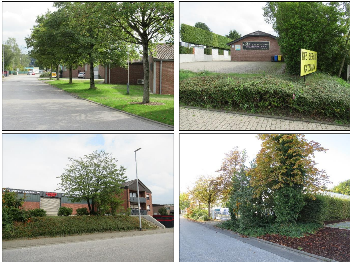
Abbildung 4: Exemplarische Grünstrukturen im Gewerbegebiet