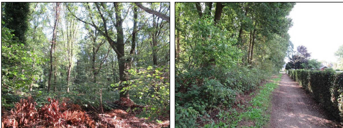
Abbildung 3: Wald nördlich des Plangebietes

Die nördlich des Plangebietes gelegene Waldfläche besteht vorwiegend aus Traubeneichen mit starkem bis mittlerem Baumholz (s. Abb. 3). Eine Teilfläche des Waldes wird von Roteichen dominiert. Der Unterwuchs besteht aus Brombeere.