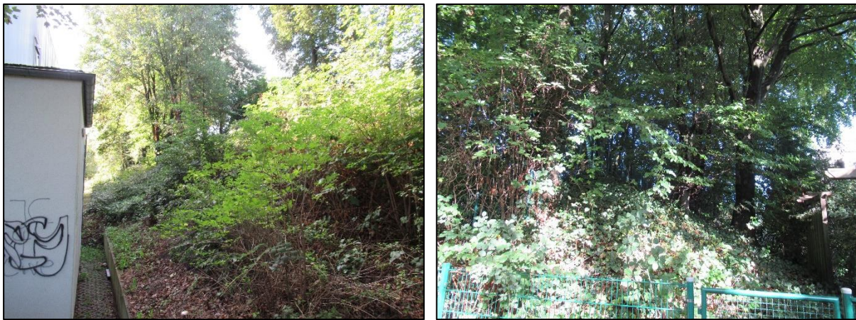
Abbildung 2: Begrünter Wall

Fuß- und Radweg quert den Wall und schafft eine Anbindung zwischen dem Gewerbegebiet und der westlichen Wohnbebauung. Der Weg wird alleeartig von Bergahornbäumen begleitet.